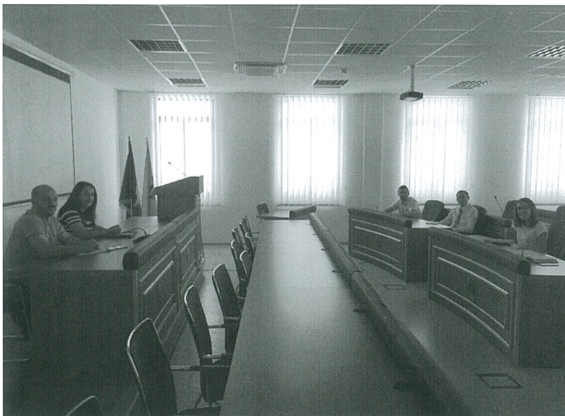
Fig.6. Anëtarët e komitetit me të ftuarit