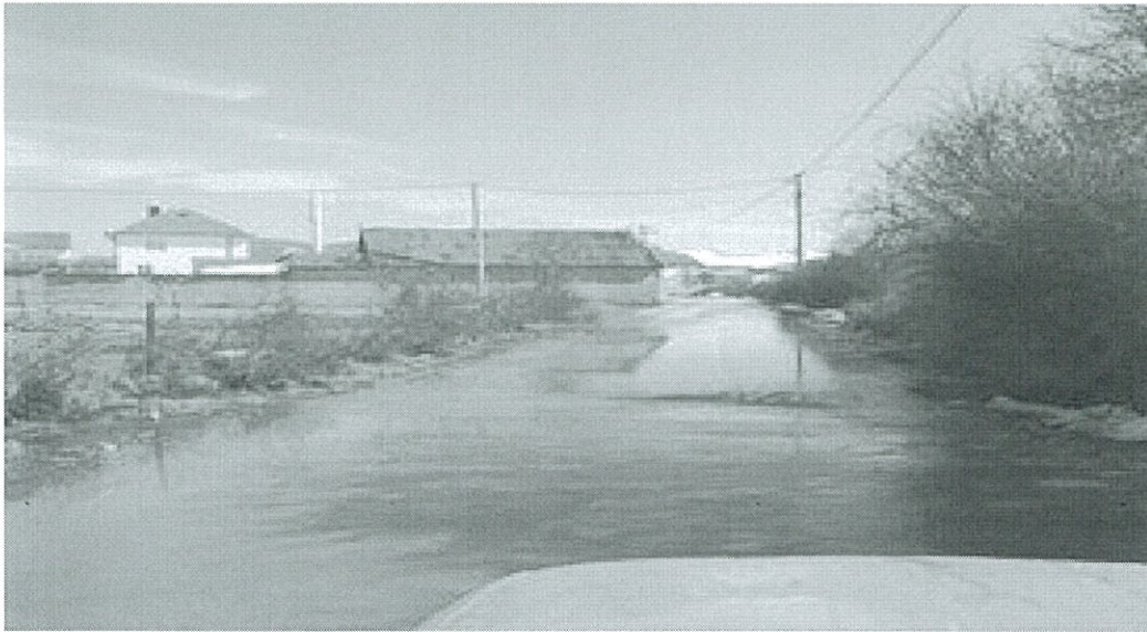
Fig.4.Hapsira me ujë para hyrjes së shkollës