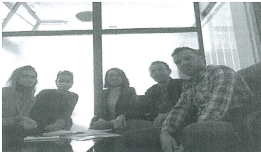
Fig.2. Anëtarët e Komitetit

Operoret industrial dhe ata energjetik janë shpenzuesit më të mëdhenj të ujit. Në rangun e operatoreve më të mëdhenj të shfrytëzimit te ujit në Kosovë radhiten: KEK, Feronikeli, dhe Sharrcemi . Këta operatorë furnizohen me ujë kryesisht nga liqenet akumuluese sipërfaqësore. Një pjesë e operatorëve të vegjël industrial, shfrytëzojnë ujin nga ujësjellësit publik, kurse një numri i vogël i tyre përdorin sistem vetanak të furnizimit me ujë nga pusët