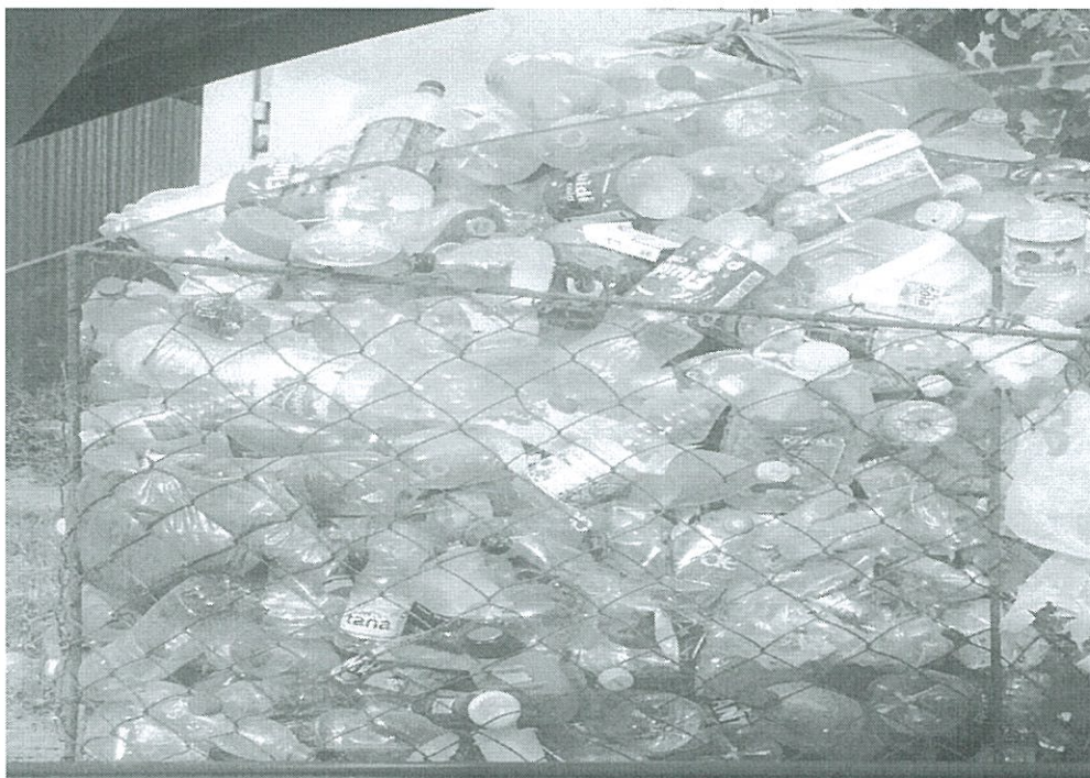
Fig.8. Një formë e grubullimit të hedhurinave plastike

Një formë se kishim mundur të bëjmë këtë ndarje kish me qenë si në foton më poshtë: