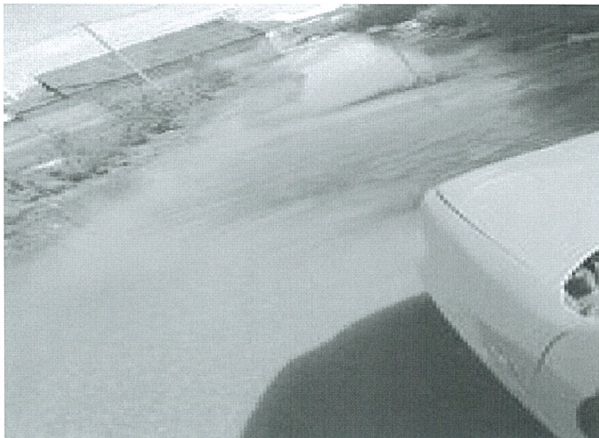
Fig.5.Hapsira me ujë para hyrjes së shkollës