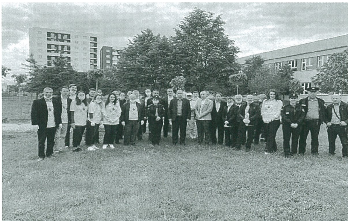
Fig.3.Shënimi I ditës ndërkombëtare të mjedisit

Me organizim nga Komuna e Drenasit përkatësisht, Drejtoria për Planifikim Urban dhe Mbrojtje të Mjedisit, dhe Drejtoria për Shërbime Publike dhe Emergjente ishim pjesë e shënimit të Ditës Ndërkombëtare të Mjedisit.Aktivitetet që shënuan këtë ditë ishin: Mbjellja e Drunjëvenë Shkollat Filllore dhe të Mesme të Ulëta :”Rasim Kiqina”, “Halil Bajraktari” dhe “Arif Shala”.