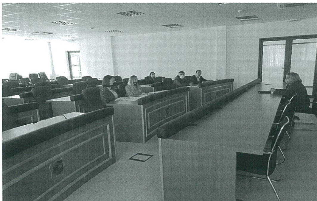
Fig.9. Takimi me znj.Krapa Drejtoreshë për Shërbime Publike dhe Emergjete

Drejtorja për Shërbime Publike dhe Emergjete nga viti 2017 është marrë me këtë problem mirpo, ne vitin 2018 kompetencat për përkujdsin ndaj qenve endacak I ka marrë AVUK (Agjensioni I Veterines dhe Ushqimit I Kosoves). Nga kjo që u tha Komuna nuk ka mundësi të marrë vendime lidhur me këtë të problem. Por, në Maj të vitit 2021 kompetencat për mbikqyrjen tjtartimin e qenëve endacak do tu kalohen Komunave.