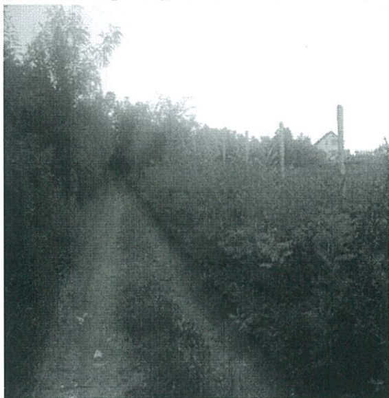
Fig.4.Pjesë e rrugës që qon te shtëpia e fundit

Përfaqesuesi I lagjës kërkohet të dihet kur do të vazhdojnë punimet për asfaltimin e rrugës dhe a ka mundësi që rruga në fjalë të shtrohet të paktën me zhavor.