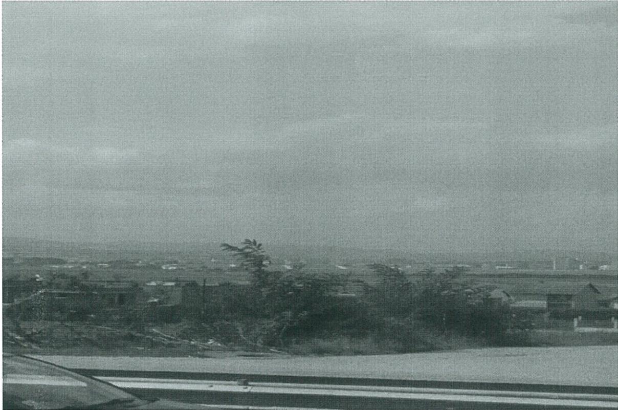
Fig.8.Mungesa e sinjalizimit

Temë tjetër diskutimi ka qenë edhe mungesa e shenjës STOP në fshatin Korroticë e Epërme më konkretisht te familjet Doshlaku, Shabani dhe Shapeta e cila është demoluar nga një aksident trafiku.