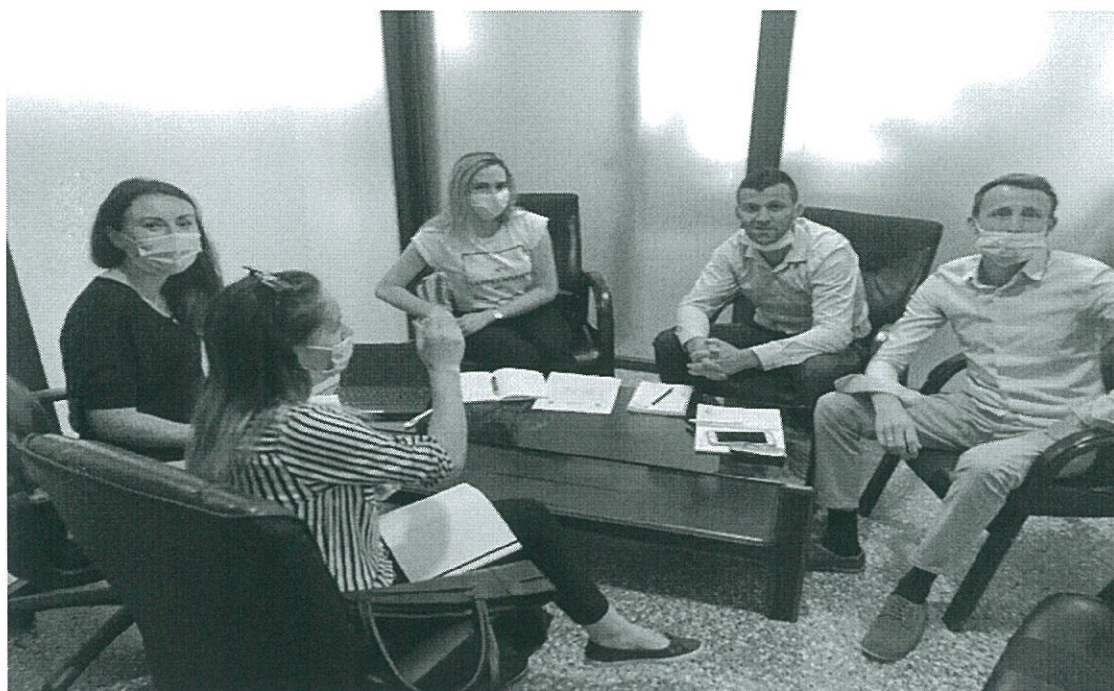
Fig.7. Anëtarët e komitetit

Nga shkencëtarët është konstatuar që fëmijët kanë potencial më të madh të përhapjes së këtij virusi se sa të rriturit, andaj duhej të merren masat që most të vije deri tek një numër I madh të infektuarve.