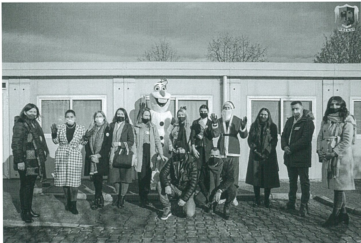
Fig.14. Aktiviteti në shpërndarjen e dhuratave tek sheshi dhe qendra Handikos