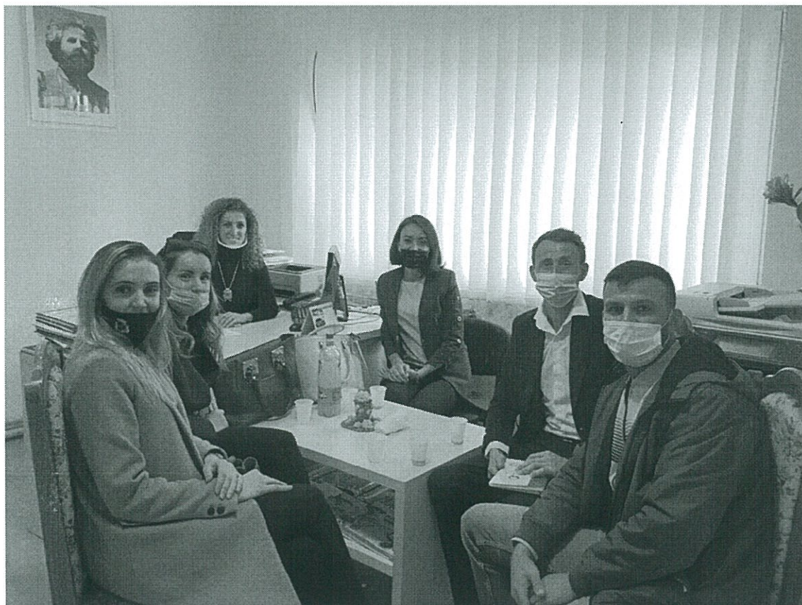
Fig.10. Vizita në kopshtin ‘Ardhmëria’ në Drenas.

Nga drejtoresha u njoftuam më për së afërmime punën e këtij institucioni të arriturat dhe vështirësitë që ka ky institucion. Komiteti jonë shprehu gatishmëri që të ofrojë ndihmë në të gjitha projektet të cilat drejtoresha do t’I realizojë në ate institucion si në Drenas poashtu edhe në njësinë e ndarë në Bushat.