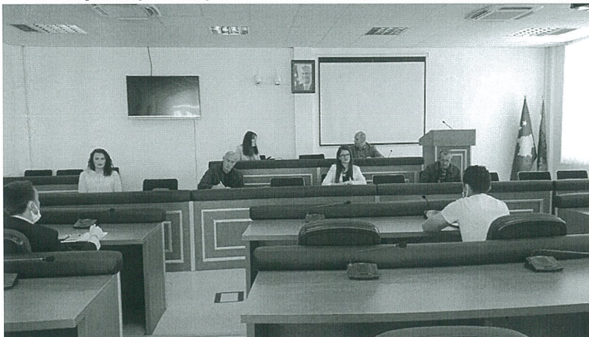
Fig.2.Takimi me kryetarin e Komunës dhe Drejtorët.

Kryetari po ashtu na njoftoi edhe për pakot ushqimore-higjienike që ka ndarë komuna së bashku me donatorët për familjet në nevojë.