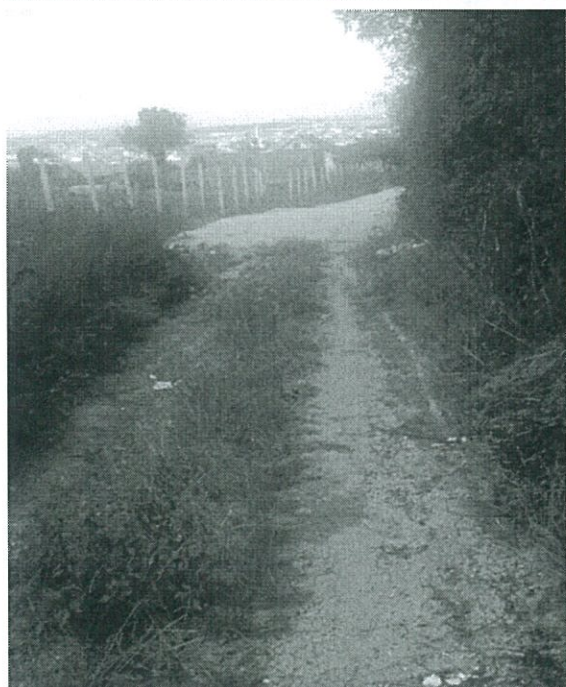
Fig.5.Nderpreja e punimeve në rrugën deri në përfundimin e saj